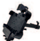
E10B socle véhicule avec key lock, Ethernet, DC jack, 2 USB, RS232 DB9, kit fixation AT-CAE1011B AT-CAE1011B1