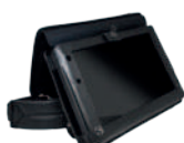
Housse avec harnais AT-CAE8010