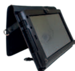
Housse avec harnais AT-CAE10L01