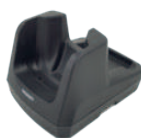
Socle bureau Ethernet AT-CART5501

Batterie amovible, très robuste, sangle arrière intégrée, écran Full HD, USB Type-C.