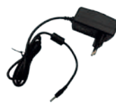
Adaptateur Secteur 5V AT-CAE805