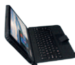
Clavier QWERTY amovible AT-CAE1210