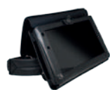
Housse avec harnais AT-CAE8L05