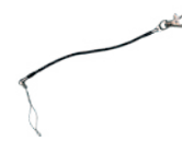
Attache stylet AT-CAE806