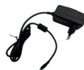
Adaptateur secteur AT-CAE805